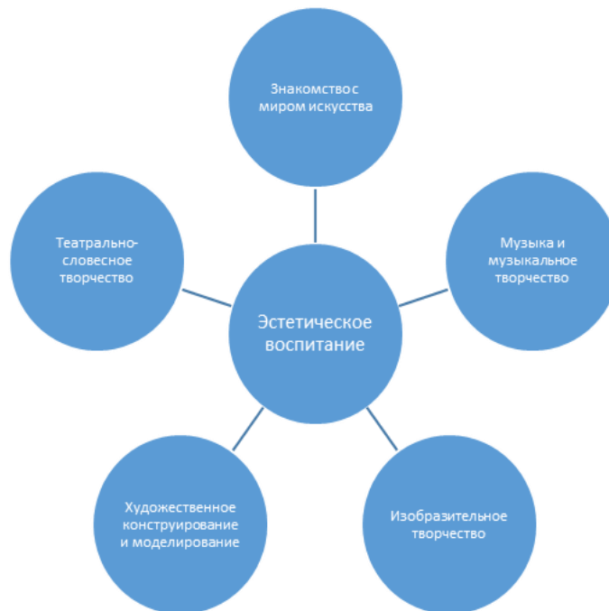
Схема «Эстетическое воспитание»

Художественно-эстетическое развитие предполагает развитие художественно-творческих способностей детей в различных видах художественной деятельности, формирование интереса и предпосылок ценностно-смыслового восприятия и понимания произведений искусства; развитие эстетического воспитания и восприятия окружающего мира, воспитание художественного вкуса.